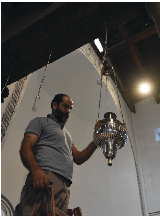
BLANKPUSSA: Ein mann heng på plass att ei av mange blankpussa røykelsekar.