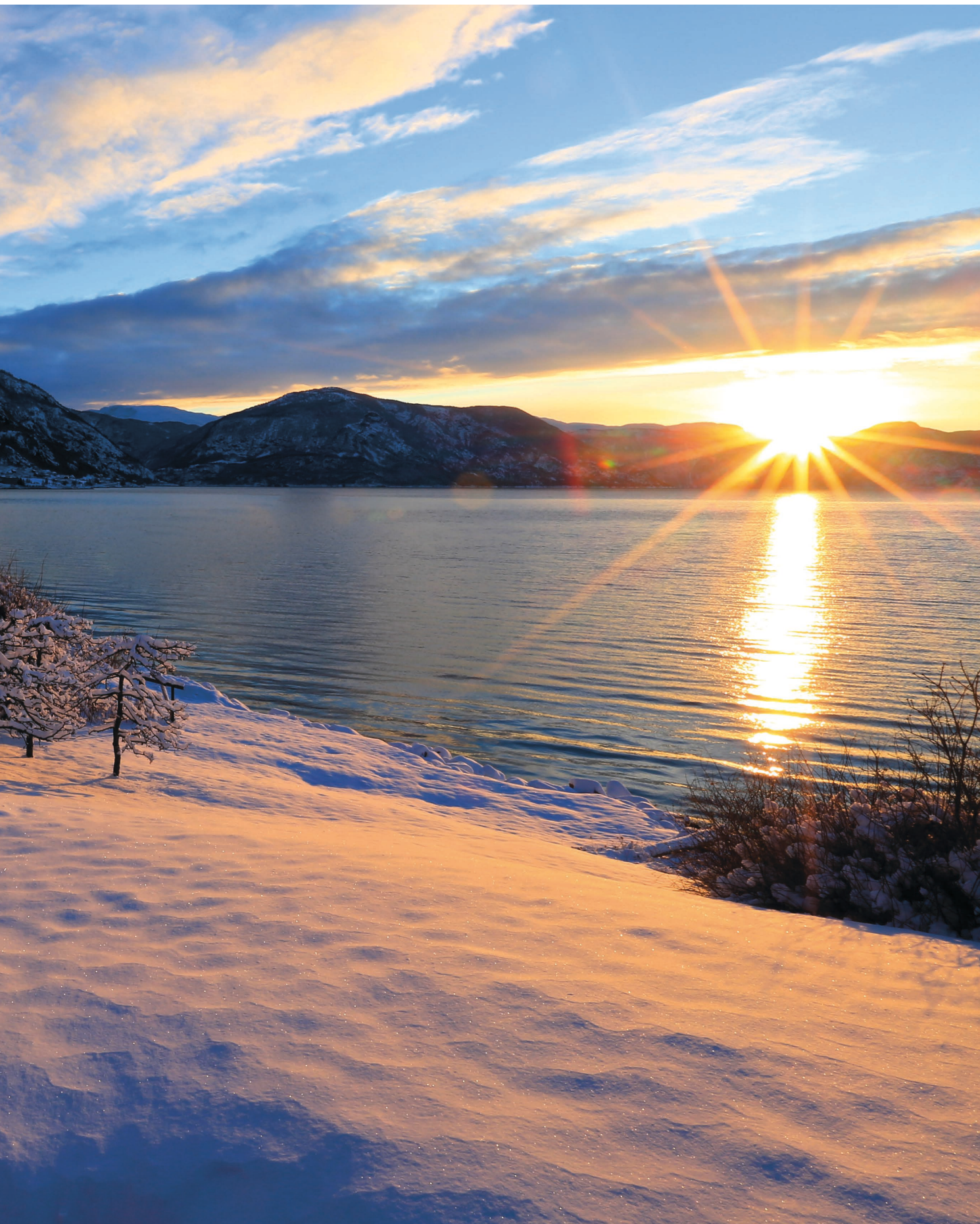
Biletet er teke frå kyrkjehagen i Leikanger.