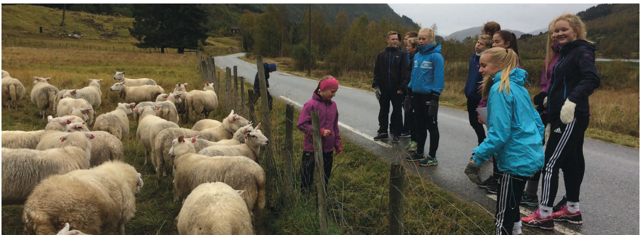
-Konfirmantar i møte med «den store kvite flokk» på Skaparverkstur i Sogndalsdalen i september.