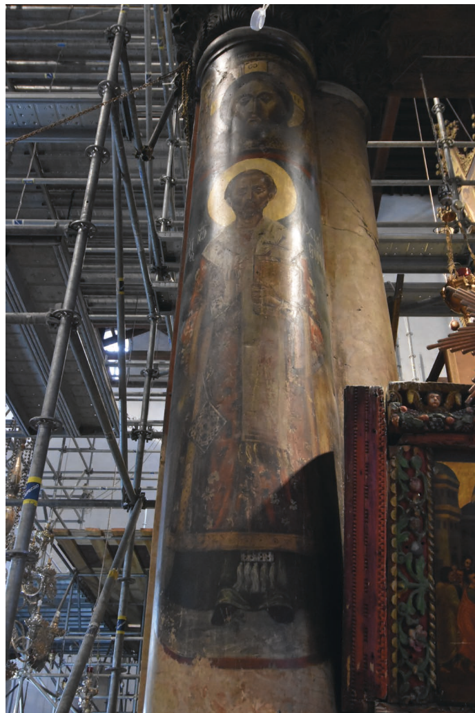
HEILAG-OLAV: Ei av dei 30 søylene i Fødselskyrkja. Vår eigen Heilag-Olav har fått biletet sitt måla på ei av søylene, men den søyla var dekket til.

Når kyrkjeklokkene ringjer jula inn, er det med ynskje om fred til alle.