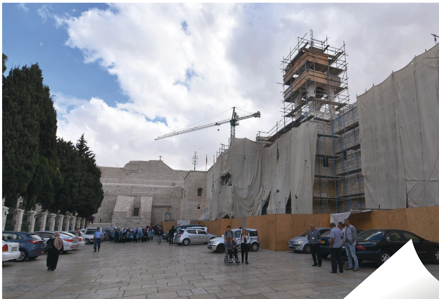
BYGGJEARBEID: Stilas på stilas i det store kyrkjerommet. Sidan 2013 har det vore eit omfattande restaureringsarbeid i kyrkja. K' arbeidet vera ferdig.

Under har hendt før, og det berre for eit par år sidan. Då mørtel og gips varsamt vart skrapa av ein av veggane, kom eit ca. 2,4 meter høgt mosaikkbilete av ein engel til syne. Andletet er belagt med perlemor og glorien er i gull. Engelen er vendt mot grotta der Jesus skal vera fødd.