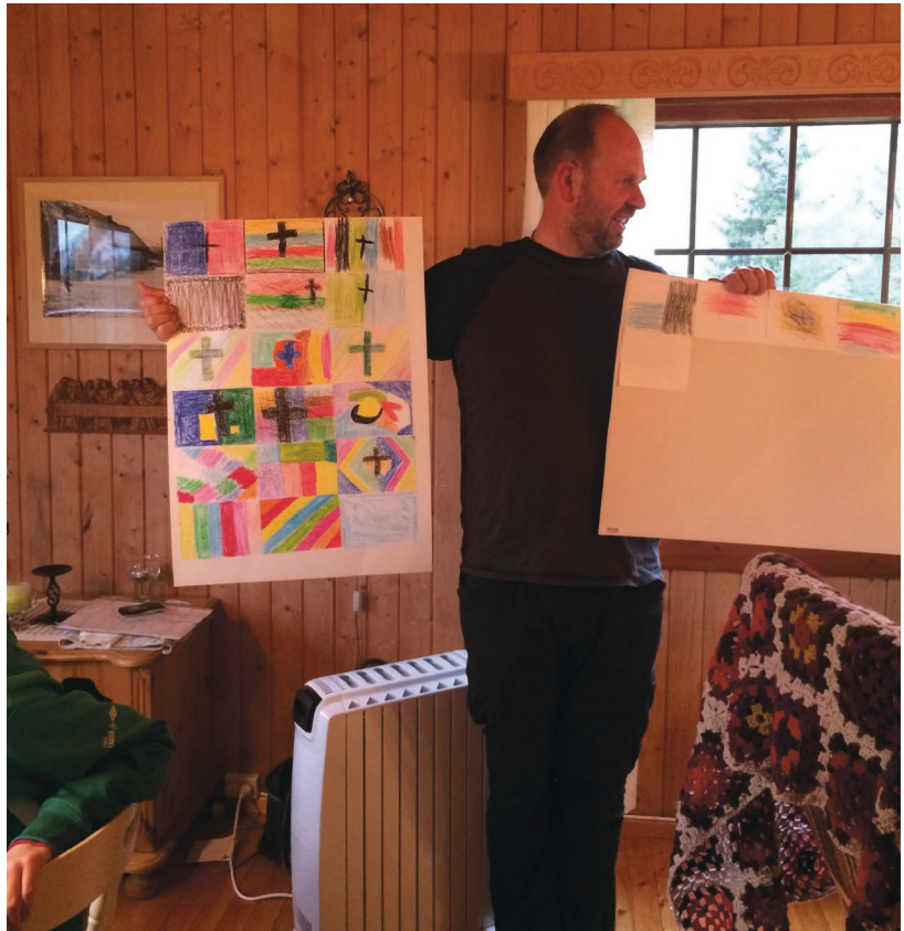
-Lønsjpause i kyrkjelydshuset under «Jesuslaurdagen» på Leikanger 4. november.

På alle gudstenester i haust har nokre av konfirmantane vore med som medhjelparar/medliturgar og hatt ulike oppgaver.