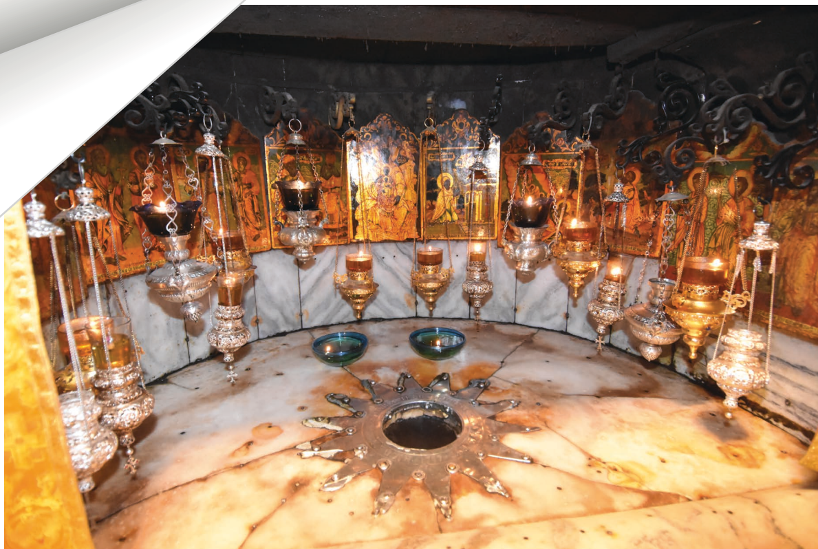
FØDESTADEN: Den store stjerna viser fødestaden til Jesus. Fødselsgrotta er hogge ut i fjellet under kyrkja, og det heng mykje lyslykter ned frå taket.

B etlehem - byen frå juleevangeliet, slik me les i Lukas- og Matteusevangelia.