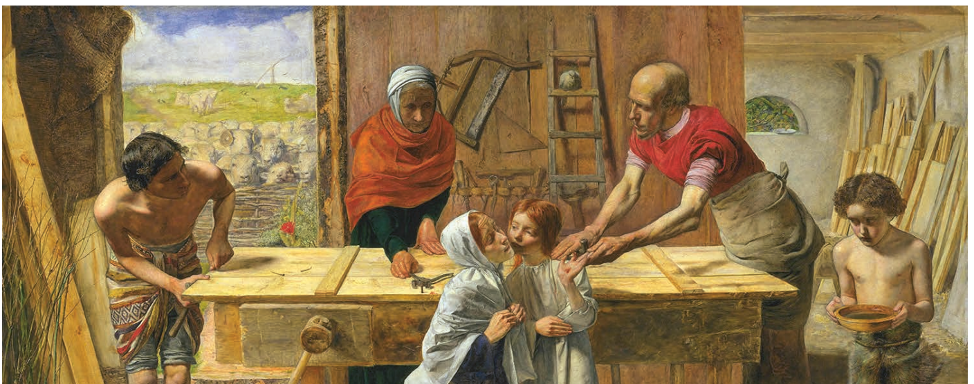
Bildetekst: Christ in the House of His Parents ('The Carpenter's Shop') 1849-50; Sir John Everett Millais, Bt 1829-1896; Tate, Purchased with assistance from the Art Fund and various subscribers 1921