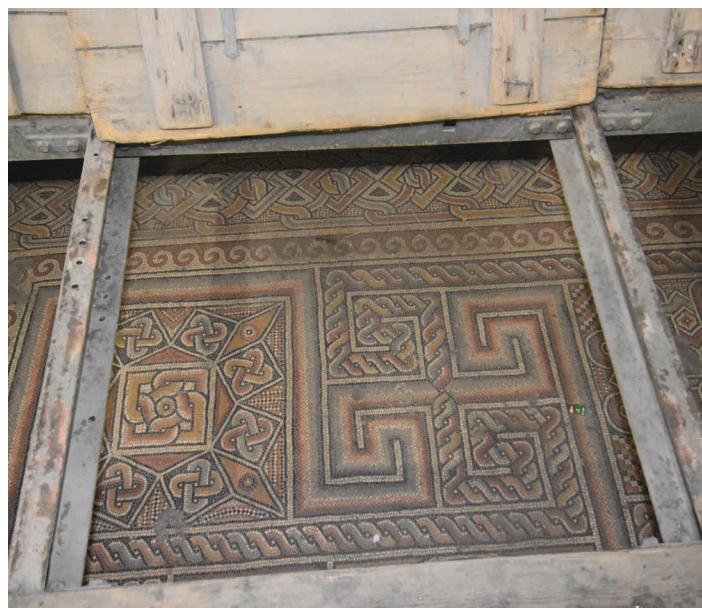
MOSAIKK: Denne mosaikken er frå 300-talet, og vart oppdaga i 1934. Det er bygd eit nytt golv for å verna det flotte mosaikkarbeidet.