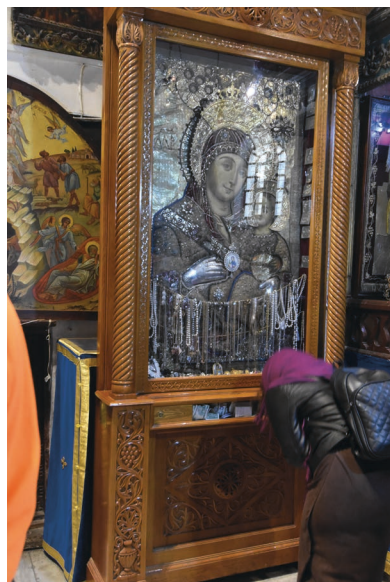
PILEGRIM: Ei av dei mange pilegrimane kysser ikonet av jomfru Maria og Jesusbarnet.

«Medan dei var der kom tida då ho skulle føda, ho fekk ein son, den førstefødde, ho sveipte han og la han i ei krubbe for dei fann ikkje husrom nokon stad».